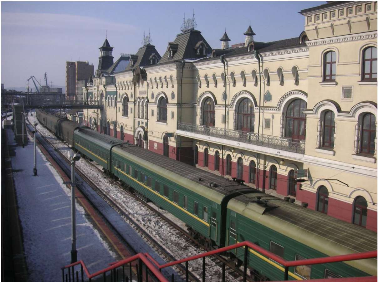
ウラジオストク駅とシベリア鉄道