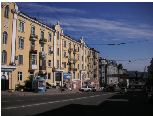
スヴェトランスカヤ通り