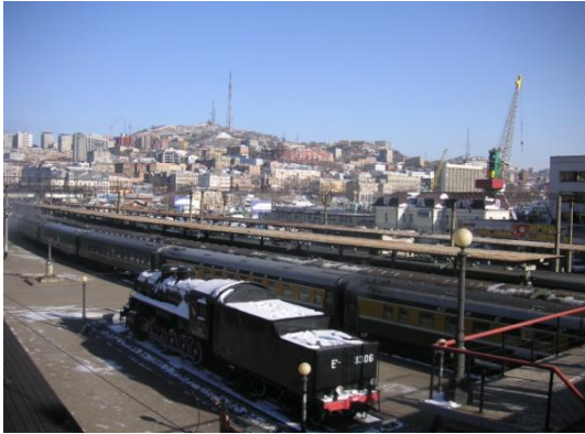
鷺の巣展望台から見る金角湾