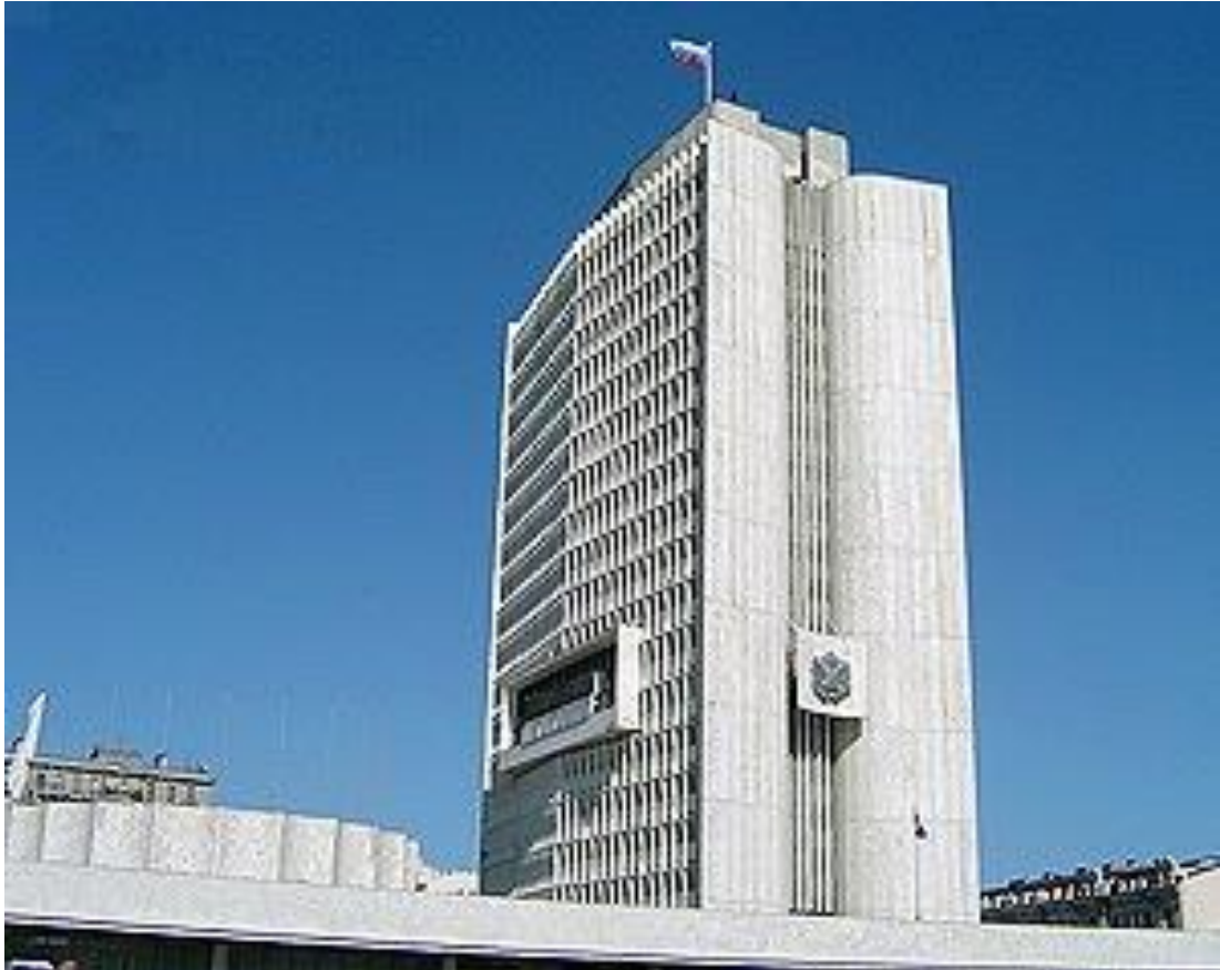
沿海地方行政府庁舎