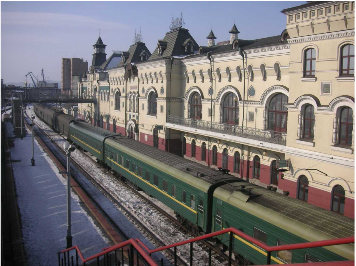
ウラジオストク駅とシベリア鉄道