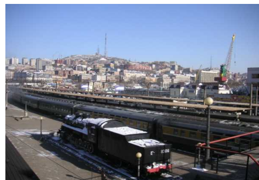
ウラジオストク駅